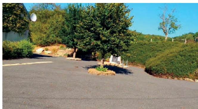
Montot place du monument.