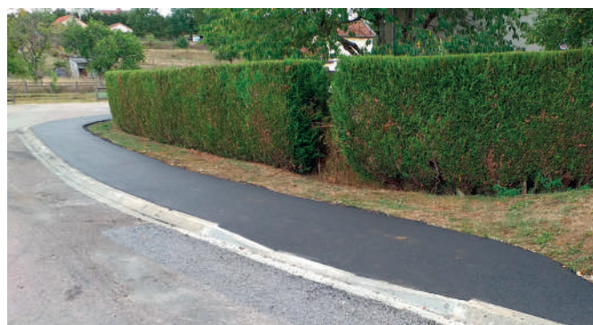
Trottoirs à Andelot.