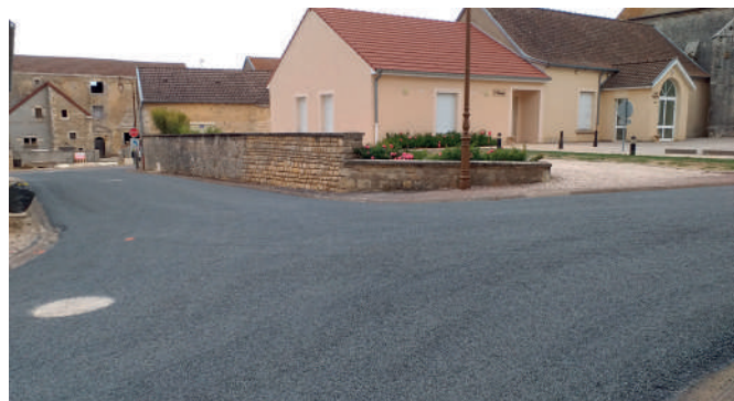
Voirie à Darmannes.

Ces statuts devraient être revus par la commission voirie puis soumis à un vote lors d'un prochain conseil communautaire.